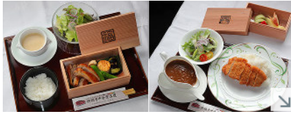
(左) 羽生竜王の2日目の昼食「大和肉鶏 テリヤキセット」、(右) 佐藤名人の2日目の昼食「カツカレーセット」=奈良市の興福寺で、三村政司撮影